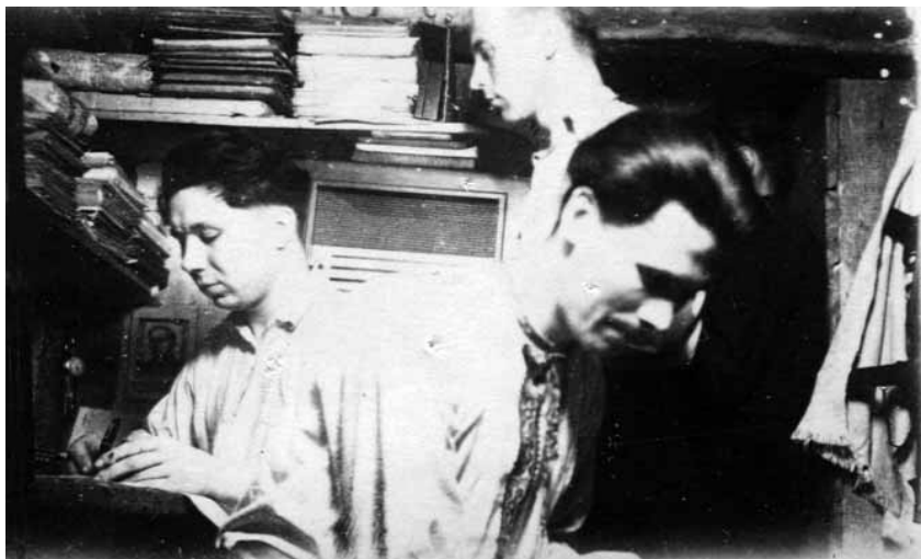
Підпільники ОУН працюють в бункері. Хмельницька область, 1950 р.

на другий план, бо інакше може статися катастрофа 25 . Очевидно, Р. Шухевич мав на увазі те, що якщо ОУН не зуміє завоювати довіру всього українського народу, то не отримає належної підтримки. Відповідно, без неї рано чи пізно радянські каральні органи розгромлять ОУН у західних областях України і покладуть край українському національно-визвольному руху.