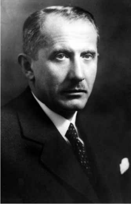
Одна з останніх прижиттєвих світлин Євгена Коновальця. Відень, весна 1938 р.

інформацію». На доказ, що він прибув з СРСР, П. Судоплатов дав деякі речі: плакати, хліб, зубну пасту та папірці від цукерок 42 .