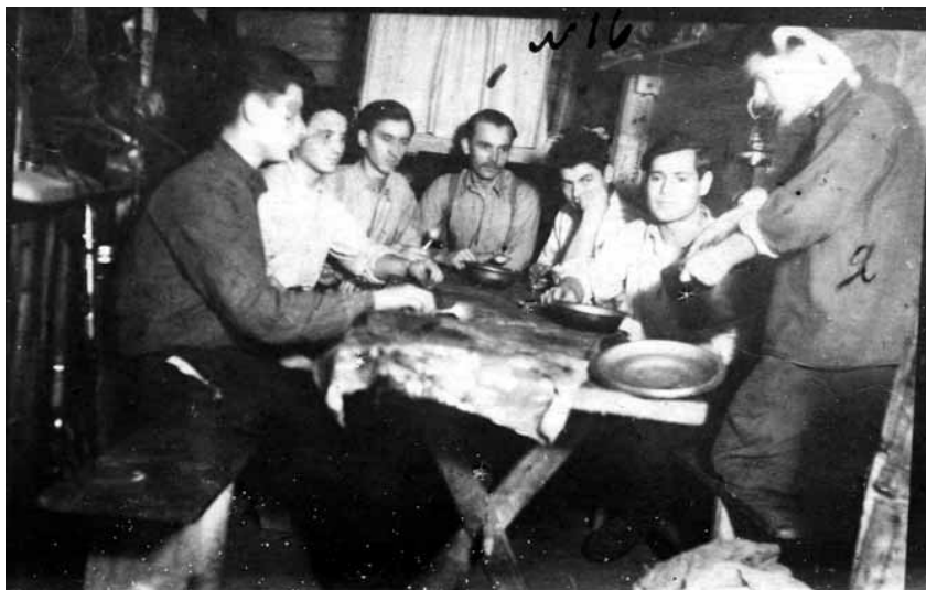
Керівник Кременецького надрайонового проводу ОУН проводить вишкіл з молоддю. 1950 р.

антирадянською 41 . На початку 1990-х рр. усі учасники цієї ланки ОУН були реабілітовані.