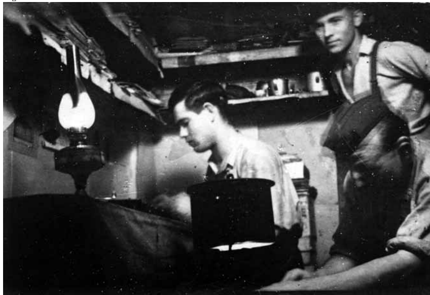
Підпільники ОУН працюють в бункері. Хмельницька область, 1950 р.

ся з українцями-східняками, переважно молоддю, та підкидали листівки й літературу в потяги, надсилали їх у листах робітникам.