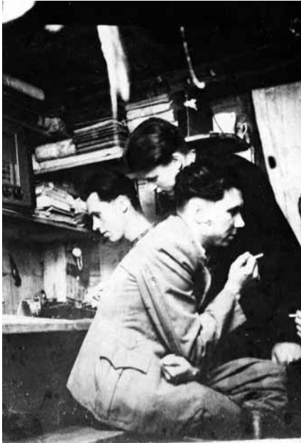
Кременецький надрайоновий провідник «Алас» та інші підпільники в бункері на території Хмельницької області. Фото 1950 р.

кримінального кодексу УРСР до 6 років виправно-трудових таборів. 28 жовтня 1991 р. прокуратура Луганської області реабілітувала Л. Безпалько через відсутність у її діях складу злочину 40 .