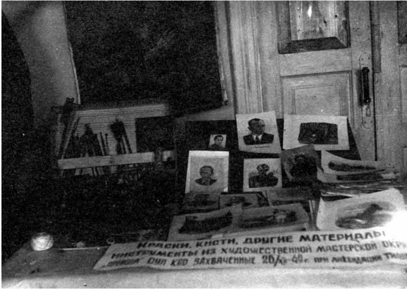
Майно типографії ОУН Кам'янець-Подільського окружного проводу ОУН

їзду в Лисичанськ невідомих осіб із західних областей України, для яких В. Адамович намагався придбати документи 56 .