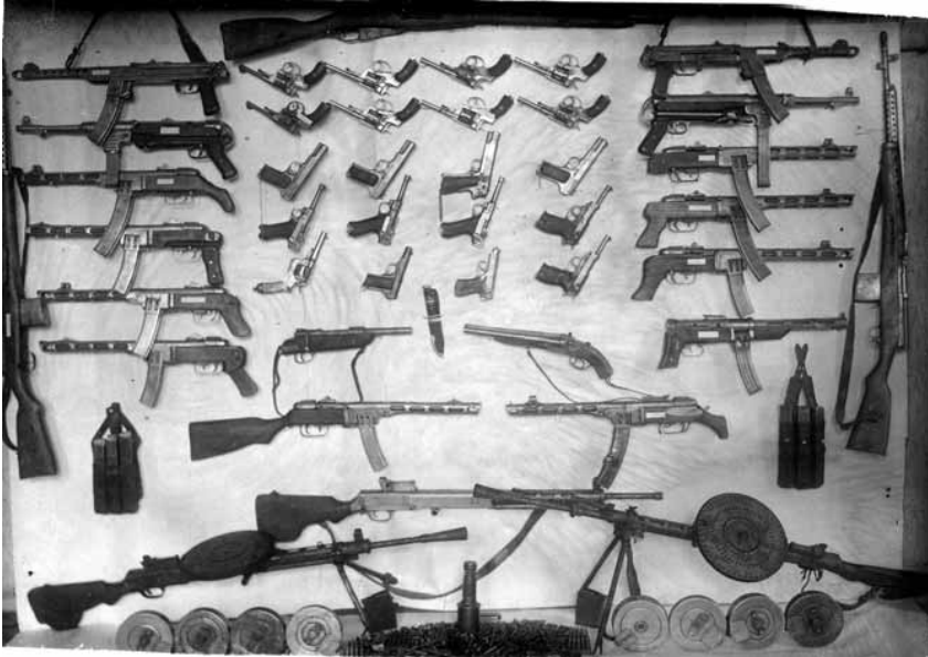
Частина зброї, яку співробітники МГБ вилучили в учасників ОУН Кам'янець-Подільського окружного проводу ОУН у 1950—1952 рр.

час, слід констатувати, що, незважаючи на сподівання керівників ОУН(б), націоналістична ідеологія не отримала масової підтримки східноукраїнського населення, яке протягом 1914—1945 рр. пережило дві світові та громадянську війни, два голодомори та сталінський терор. Варто відзначити, що російськомовних українців відлякувала не лише небезпека арешту за подібну діяльність, але й радикальні заклики ОУН на кшталт «Україна для українців!»