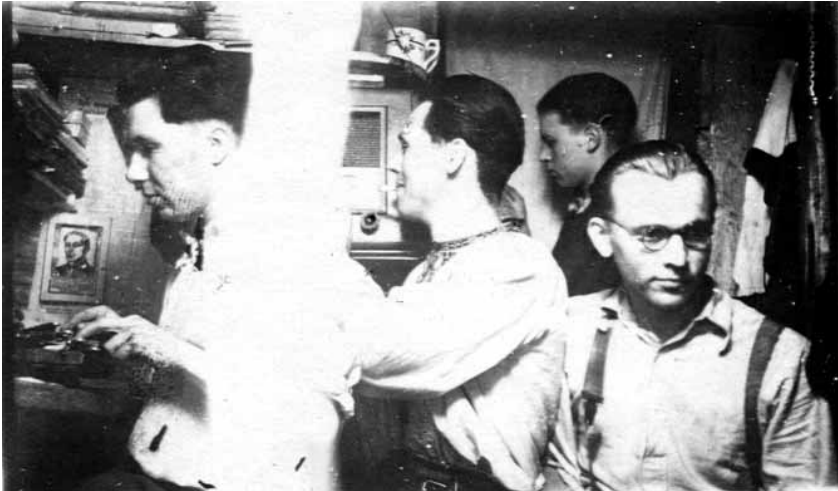
Кременецький надрайоновий провідник «Алас» та інші підпільники в бункері. 1950 р.

були залякані та сумнівались у перемозі ідей ОУН, порівнюючи сили ОУН і радянської влади 39 .