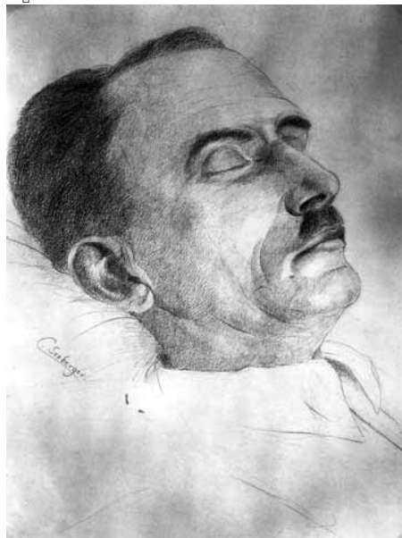
Посмертний портрет Є. Коновальця