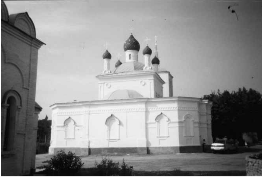
Церква Св. Покрови. Дубовка, серпень 2006 р.