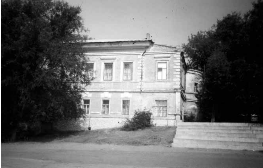
Будинок Челюканова на набережній у Дубовці, де мешкали А. Мельник, І. Чмола, В. Кучабський та 14 інших старшин. Серпень 2006 р.

усі пройшли в українських політичних партіях, молодіжних громадських і мілітарних товариствах, мали воєнний досвід. І аж ніяк не випадково буквально усі бранці царицинських таборів — Є. Коновалець, А. Мельник, Р. Сушко, В. Кучабський, І. Чмола та ін. — у ході національно-визвольних змагань 1917—1921 рр. стали військово-політичною елітою нації.