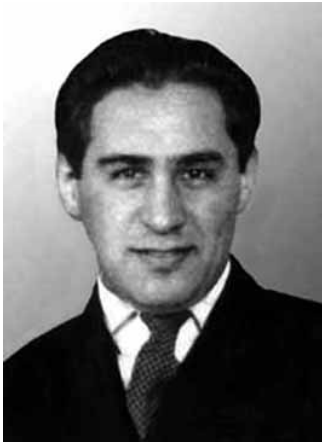
Павло Судоплатов. Берлін, 1936 р.

Подіям 23 травня 1938 р. в Роттердамі присвячено низку наукових та популярних публікацій. Проблема була піднята після розсекречення 1992 р. імені вбивці Євгена Коновальця. Ним виявився голова відділу Головного управління державної безпеки НКВД СРСР та заступник керівника 2-го Головного управління МВД (розвідка за кордоном) генерал-лейтенант Павло Судоплатов (1907—1996). Проте діяльність агента ОГПУ-НКВД* у 1934—1938 рр., як і загалом радянської агентури в структурах ОУН, до сьогодні залишається темою, фактично не дослідженою в українській історичній науці.