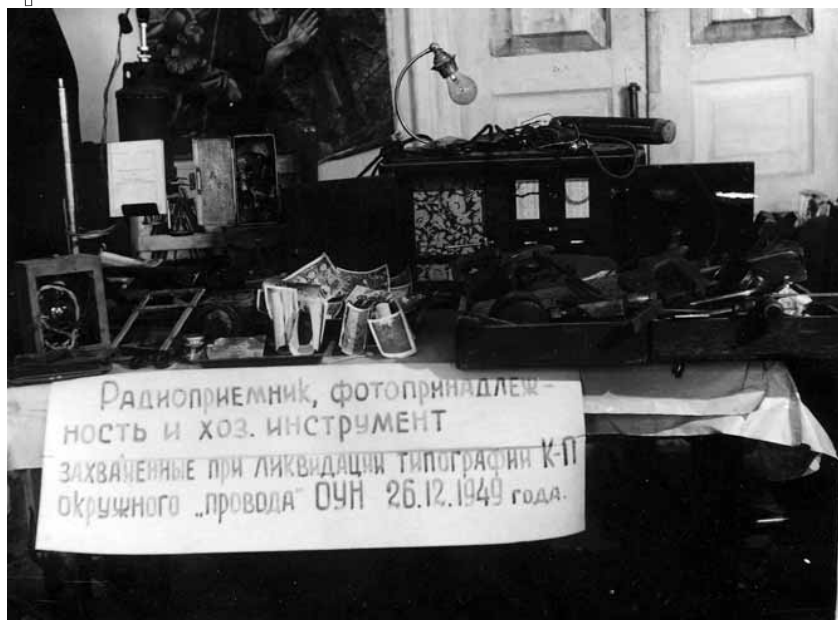
Майно типографії ОУН Кам'янець-Подільського окружного проводу ОУН