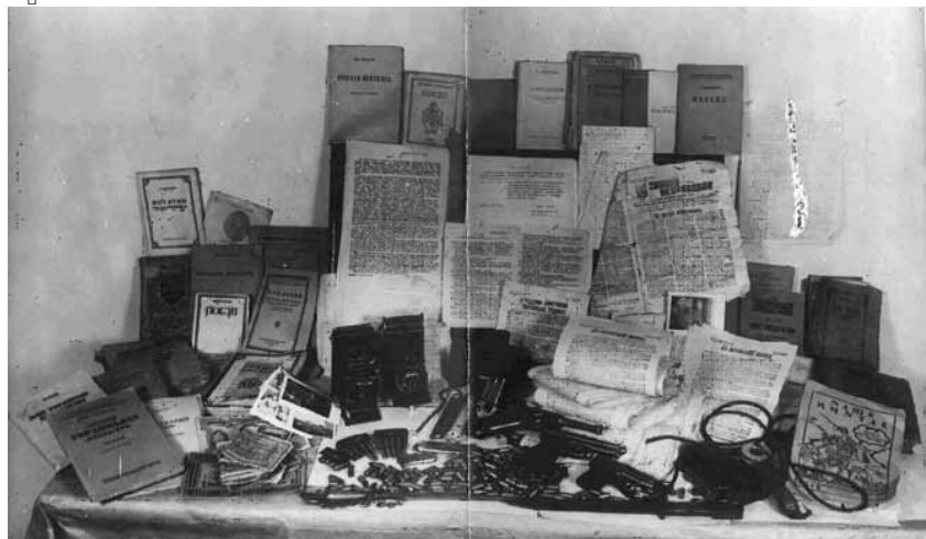
Література, листівки, зброя та інші речі, вилучені в учасників Київської молодіжної ланки ОУН 1948 р.

Підсумовуючи результати дослідження діяльності ОУН(б) в Центральній та Східній Україні, варто зазначити, що найактивнішою вона була за часів німецької окупації в 1941—1943 рр. Саме тоді ОУН(б) вдалося здобути певний авторитет серед молоді. Можливо, це пов'язано з тим, що німці, перебуваючи у стані війни з СРСР, не мали можливості приділити достатньо уваги розгрому підпілля на контрольованих територіях. З іншого боку, частина місцевого українського населення в надії на кращу долю співпрацювала і з німцями, і з ОУН.