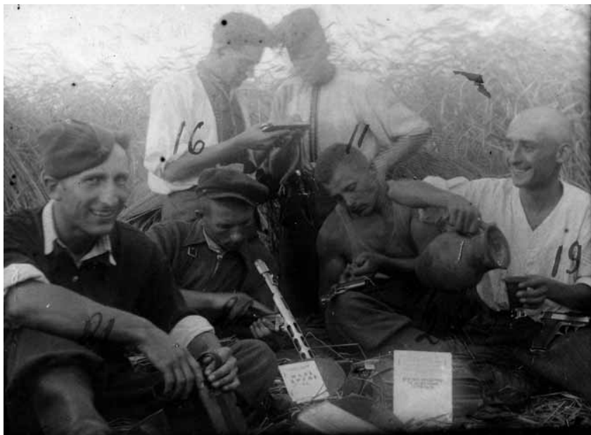
Підпільники з Кам'янець-Подільського окружного проводу ОУН