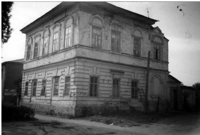
Будинок Челюканова в Дубовці, де мешкали 18 старшин і підстаршин. Серпень 2006 р.

Василя Різника. Величезне враження зробив цей хор на мешканців міста в часі похорону хорунжого УСС Михайла Дорошенка, що мабуть в травні 1917 р. згинув трагічно, під час купелі в річці Волзі. Безсмертне “Святий Боже” і “Со святими” заворожили масу народу, що мовчазно посувалися вулицями за труною. Православні священники, які провадили похорон, постійно просили диригента, щоб хор співав “Святий Боже”. Зворушливу промову сказав тоді Андрій Мельник. На пам’ятнику, що його коштами УСС і з допомогою українців на православному цвинтарі в Дубовці побудовано, була вмурована металева таблиця з написом: “Тут спочиває хорунжий Українських Січових Стрільців сл. п. Михайло Дорошенко” 12 .