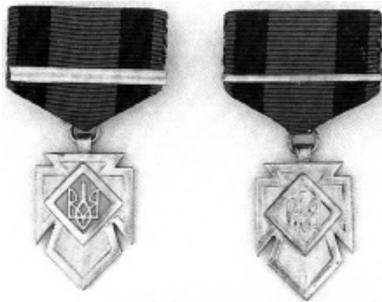
Фото 6. Хрести заслуги УПА. Золотий хрест заслуг 1-го класу помилково зображений з двома пасаками (перший зліва)