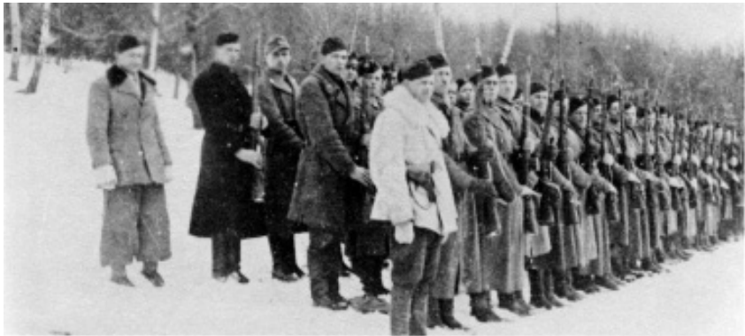
Фото 1. Невідома сотня Третьої ВО «Лисоня» готова до звіту (після команди «Почесть крісом дай!»). Зима 1943–1944 рр.