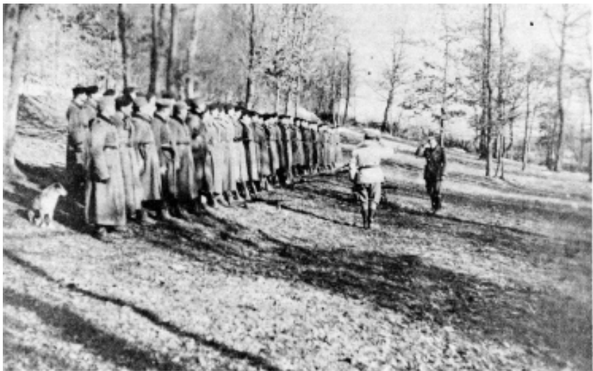
Фото 2. Командир відділу УПА, мабуть сотенний (у білому кожушку), звітує шефові штабу Третьої ВО «Лисоня» перед виструнченою в трилаві сотнею. Поч. весни 1944 р. – в гущавині, між деревами, ще біліє сніг