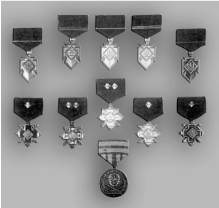
Фото 3. Комплект нагород УПА, вилучений у керівника підпілля Головного командира УПА Василя Кука – «Леміша»

«Ордени, медалі й відзначення» 13 подав дві світлини під назвою «Упівські відзначення», де зірки-ромби на стяжках теж відповідають поясненню Ніла Хасевича.