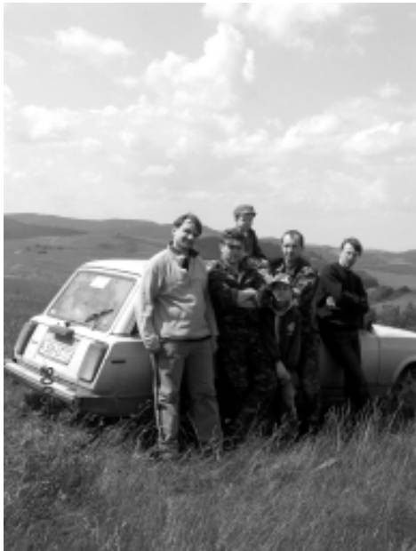
Під час польової експедиції в с. Кальна (Долинський р-н Івано-Франківської обл.)

мендованих джерел та літератури, планується підготувати курс лекцій.