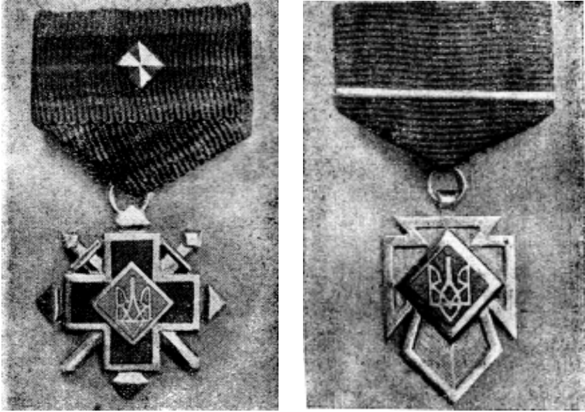
Фото 2. Найперше фотографічне зображення Золотого хреста бойової заслуги 1-го класу з однією зіркою-ромбом та Золотого хреста заслуг 1-го класу з одним паском

нагород УПА вищих класів відповідає поясненню до проектів Ніла Хасевича. З цього можна зробити висновок, що першу партію бойових нагород було виконано відповідно до принципу Ніла Хасевича: кількість зірок-ромбів та пасків відповідає класові ордена.