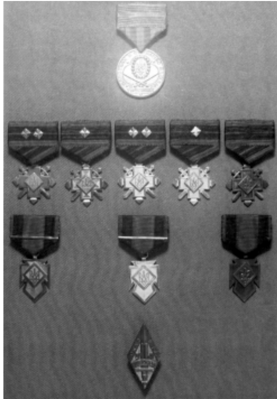
Фото 4. Кольорова вкладка до 9-го тому «Літопису УПА»

На нашу думку, помилка з'явилась і почала масово ширитися через появу зображення бойових нагород УПА на кольоровій вкладці до 9-го тому «Літопису УПА», виданого 1982 р. (Торонто, Канада). Тут ми вже бачимо (фото 4), що Золотий хрест бойової заслуги 1-го класу чомусь має на стяжці дві зірки-ромби, хоча Золотий хрест заслуг 1-го класу зображений правильно – з одним паском. Як згадує