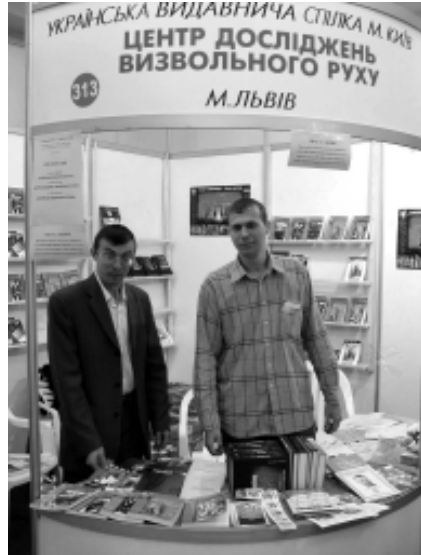
Стенд ЦДВР та Української видавничої спілки на Форумі видавців у Львові

Традиційним стало проведення щорічної наукової конференції ЦДВР. 2005р. це була науково-практична конференція «Український визвольний рух 1920-х – 1950-х років: проблеми теорії та методології досліджень», що відбулася 19 листопада в конференц-залі Наукового товариства ім. Тараса Шевченка. Науковці розглянули питання, пов'язані з особливостями вивчення політичної думки та ідеології, усної історії, гендерних відносин, джерел, біографій, періодизації, статистики, пам'яток та символіки українського визвольного руху. Під час жвавого обговорення цих питань присутні зробили низку важливих