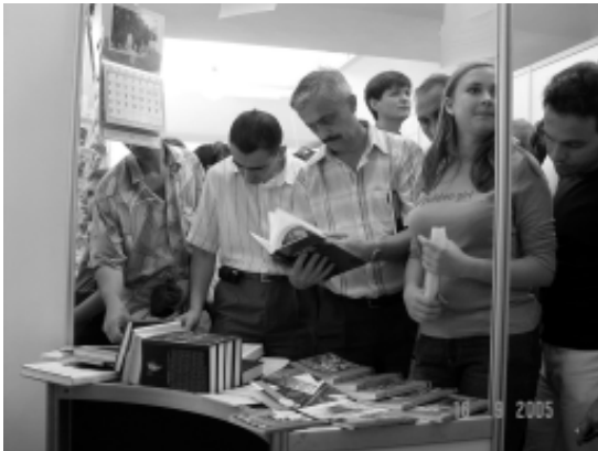
Відвідувачі стенду на Форумі видавців у Львові

концептуальних висновків, необхідних, щоб удосконалити методологію досліджень визвольного руху. Найважливіший із них полягає в тому, що подібні конференції потрібно організувати й надалі, адже, як стало зрозуміло, дослідники руху слабо обізнані з основними принципами методології та найновішими здобутками теорії історичної науки.