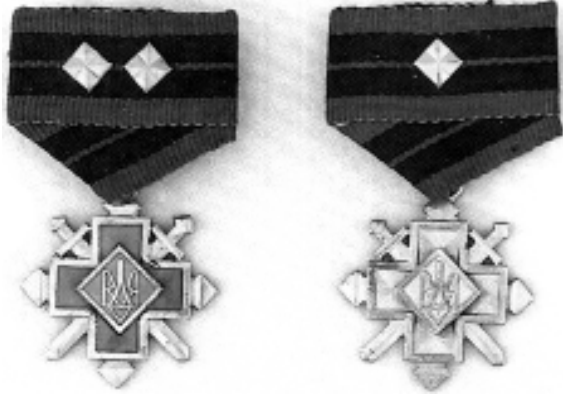
Фото 5. Хрести бойової заслуги УПА. Золотий хрест бойової заслуги 1-го класу помилково зображений з двома зірками-ромбами (перший зліва)

емаллю, а крім того, наявністю двох золотих зірок на колодці. На стрічці Срібного хреста бойової заслуги 1-го класу розташовувалось дві срібні зірочки, а на стрічці 2-го класу – одна. Золотий хрест заслуги 1-го класу мав у центрі хреста золотий тризуб на синьому тлі та подвійний