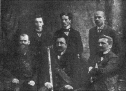
Генеральна Старшина "Українського Січового Союзу" у Львові

та інших українських землях. Сучасні дослідження І. Андрухів 1 , А. Доценка 2 , М. та Н. Лазарович 3 , Є. Приступи та О. Винничука 4 , Б. Трофим'яка 5 та інших висвітлюють більше історію українських молодіжних товариств та організацій, а символіка в їхніх працях лише