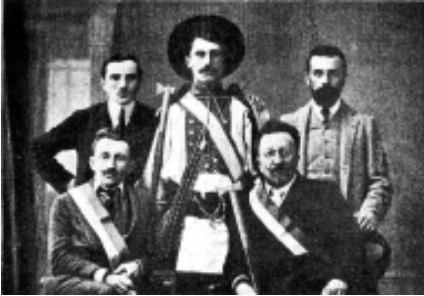
Січова делегація на злеті хорватських “Соколів” у Загребі. 1911 р.

літичних та культурних діячів. Посвячення прапорів товариств “Січ” закордоном відбувалося також. Так 19 листопада 1910 р. у Нью-Йорку члени українського товариства “Запорозька Січ” (товариство налічувало 85 членів) в урочистій обстановці посвятили свій прапор. Посвятив прапор о. Н. Підгорецький у церкві святого Юрія 22 .