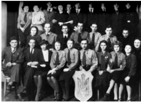
СУМ у Харбіні