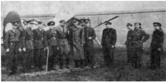
Зустріч чехословацьких та польських старшин. 1947 р.

За твердженням польських істориків Антоні Щесняка і Веслава Шоти, початки антиповстанської співпраці між СРСР та Польщею припадають на другу половину 1944 та першу половину 1945 років, коли польські війська ще не могли виставити біль-