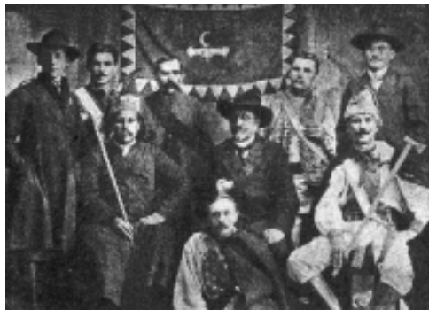
Комітет Шостого січового свята у Снятині. 12 липня 1912 р.

Символіка пожежно-спортивних товариств “Січ” у Галичині не була предметом вивчення, а фундаментальні роботи з комплексного дослідження еволюції прапорництва, емблематики, відзнак та печаток січового руху взагалі відсутні. У радянській історіографії немає ґрунтовних праць з історії, а тим більше з символіки вищезгаданих товариств, оскільки “Січі” вважалися “буржуазно-націоналістичними” товариствами. Лише у 90-их рр. XX ст. з’явилася змога дослідити історію та діяльність товариств “Січ” на теренах Галичини, Буковини, Закарпаття