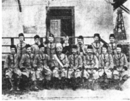
Повітова “Січ” у Бережанах

никами-аматорами і були не завжди високої мистецької вартості. Окремі заможні товариства “Січ” винаймали для цієї справи професійних художників. Одним серед них був Ярослав Пестрак, видатний український художник родом з покутського містечка Гвіздця, автор прекрасних картин з життя селян на Покутті 14 . Починаючи з 1910 р. повітові “Січі” використовують синьо-жовті прапори з малиновими стрічками. Взагалі поєднання синього, жовтого та малинового кольорів було надзвичайно характерним для початку ХХ ст. Це простежується на прикладі символіки таких пожежно-спортивних та спортивних товариств як “Сокіл-Батько”, спортивне товариство “Україна” та ін.