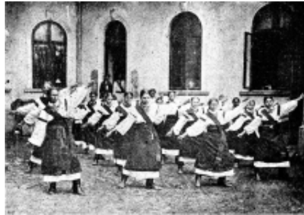
Січовички в одностроях з с. Печеніжин Коломийського повіту

Взагалі, влада не була в захопленні від того, що багато людей носили січові ленти. За носіння лент покарано тисячі