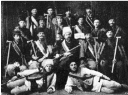
Пожежно-гімнастичний курс у Коломиї. Жовтень 1908 р.

Серед січових відзнак слід виокремити ювілейні відзнаки. У 1914 р. за задумом Івана Боберського інженер Роман Грицай створив відзнаку для Шевченківського здвигу, який відбувся 28 червня 1914 р. у місті Львові на честь 100-річчя від дня народження Т. Г. Шевченка 35 . Відзнака мала форму трикутника, який по трьох боках мав півкруги. В цих півкругах поміщені