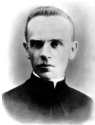
о. Микола Хмільовський

Народився Микола Хмільовський у селянській сім'ї 18 травня 1880 року в селі Покропивна, що на Тернопільщині. Незважаючи на матеріальну скруту, батьки постановили дати добру освіту своєму сину. Навчатись йому було легко, і 1901 року він стає студентом теологічного факультету Львівського університету. Закінчивши його, Микола Хмільовський одружується з Софією Підсонською, а згодом виїжджає до Відня продовжувати теологічні студії. У 1907 році він став священником 1 . Цього ж року подружжя Хмільовських перебирається у Золочів, де о. Микола стає членом “Просвіти”, Українського Педагогічного Товариства, а також активним учасником громадсько-політичного життя Золочівщини. Тут він обіймає посаду катехита місцевих шкіл і державної гімназії. В період з 1913 по 1917 роки о. Хмільовський очолював Золочівську школу ім. Маркіяна Шашкевича 2 . Подальше керування цією школою перервала Перша світова війна. Його вихованці зголошуються добровольцями до Легіону УСС, який розглядали, як основа майбутньої української армії в боротьбі за незалежність України. Отець Хмільовський теж прагне потрапити до цієї формації. У листі до В. Старосольського, який займався формуванням Легіону УСС, він пише: “[...] голоситься ще один воїн, а то