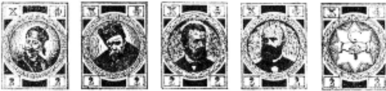
Марки селянського фонду

зображення 61 . 2) Печатки із зображенням двох рук, з'єднаних в потиску, у восьмипроменевій зірці та без неї. Часом до зображення додавали ще літери Р. П. 62 3) Печатки із особливим зображенням. Це печатка товариства "Січ" в с. Чортківці-Великі (на ній зображено герб Галичини – Лев у короні, повернений вліво), а також печатка у Корчині, на якій у центральному колі – портрет Т. Г. Шевченка 63 . Ці печатки трапляються доволі рідко.