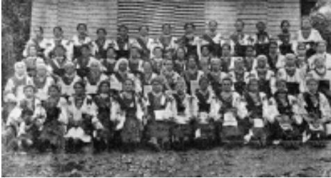
Січовички з с. Ілинець Снятинського повіту

Носіння відзнак та використання прапора членами організації “Січ”, згідно з розпорядженням Міністерства внутрішніх справ від 10 вересня 1895