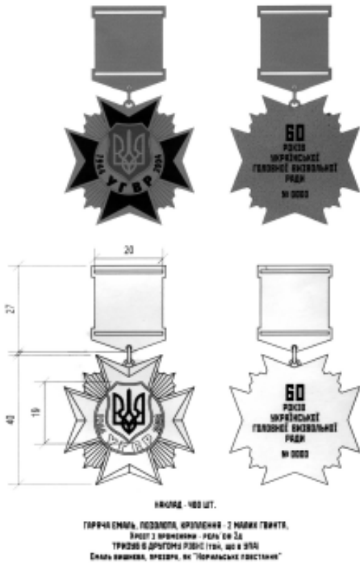
Аверс та реверс ювілейної відзнаки "60 років УГВР"

Наклад відзнаки "60 років УГВР" виявився досить невеликим, як на звичайну ювілейну відзнаку. Ветеранам національно-визвольних змагань та активним учасникам державотворення серед ветеранських організацій в Україні і за кордоном було надано всього 400 екземплярів відзнаки. Така невелика кількість відзнаки "60 років УГВР" тільки підкреслила її особливий статус серед інших українських ювілейних відзнак.