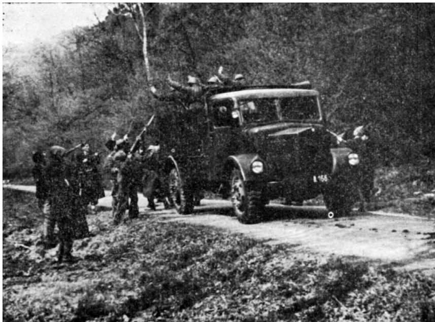
Загін «Карпатської Січі» роззброює угорських військових. Березень 1939 р.