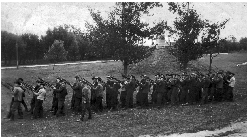
Вишкіл підрозділу винищувального батальйону. Проводить офіцер НКВД