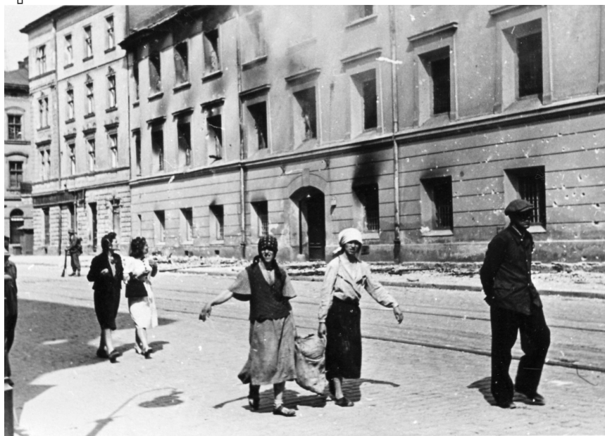
В'язниця «Бригідки» на вул. Городоцькій у Львові, червень 1941 р.

в'язниця (на вул. Замарстинівській), № 4 — в'язниця «Бригідки» на вул. Казимирській (тепер Городоцька). В'язниця № 3 розташовувалась у м. Золочеві (у тогочасних документах — Злочів) — у внутрішніх приміщеннях замку. Згідно з довідкою про «Дислокацію, ліміт і наповнення тюрем Української РСР станом на 10 червня 1941 р.» 20 , у Львові перебувала така кількість арештованих: у в'язниці № 1 за ліміту 1 500 осіб — 3 638 в'язнів, у в'язниці № 2 при ліміті 270 осіб — 801, у в'язниці № 4 при ліміті 300 осіб — 706, у в'язниці № 3 при ліміті 350 осіб — 625. Отож, у Львові станом на 10 червня 1941 р. утримували 5 145 в'язнів, із них 70,7% — у тюрмі № 1.