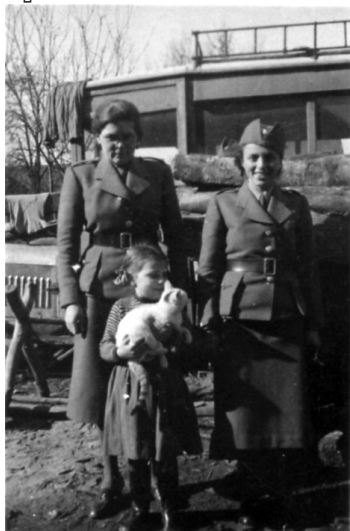
Жінки – члени Карпатської Січі. 1939 р.