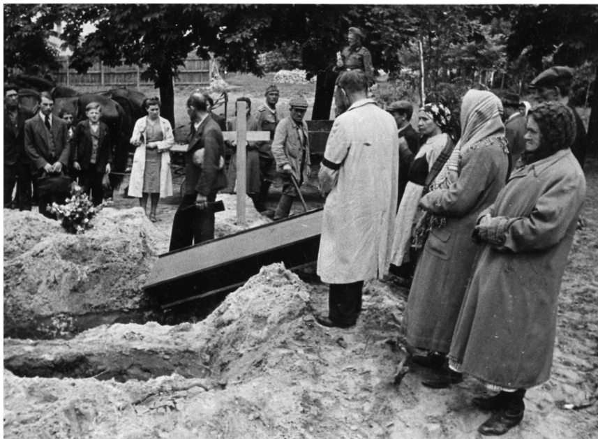
У Львові ховають жертв розстрілів НКВД. Серпень 1941 р.

Протягом першої радянської окупації звіти НКВД неодноразово відзначали напади членів ОУН на тюрми з метою звільнити в'язнів. У ніч з 23 на 24 червня 1941 р. відбувся напад на тюрму № 1, що спричинив втечу групи арештантів. Весь особовий склад тюрми разом із конвойною ротою, що несла зовнішню охорону в'язниці, покинув місто за наказом Військового штабу і через 4 години повернувся назад. За цей час бойовики ОУН напали на приміщення тюрми та звільнили, за різними даними, від 220 до 362 осіб (автор статті ознайомився з чотирма звітними документами НКВД про ці події, в кожному з них фігурують різні дані). Згідно з «Доповідною про службову діяльність 233-го полку Конвойних військ НКВД за період з 22.6.41 до 29.7.41»: «[...] під час відходу зі Львова в 2-ге, тобто 24.6.41, одночасно розпорядженням начальника УНКВД було знято з тюрми наглядацький склад, а також військову охорону полку. В'язні, залишені в тюрмі № 1, що мала більше 3 000 з/к, зламали камери та здійснили масову