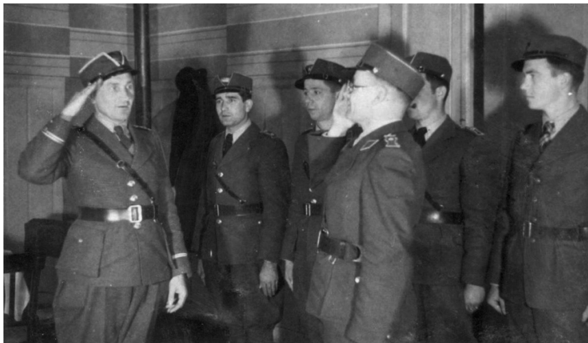
У штабі Карпатської Січі

фінансову допомогу західноукраїнських торгово-економічних установ зайвою з огляду на нову конфігурацію міжнародної політичної ситуації. Членам ОУН було ще раз суворо заборонено переходити на Закарпаття самовільно, без наказу вищих організаційних чинників.