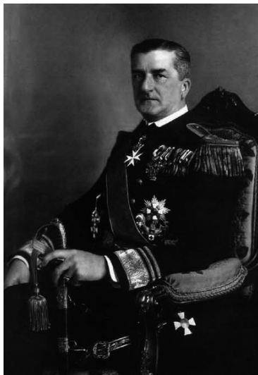
Міклош Горті — диктатор, регент Королівства Угорщина (1920—1944)

Основні частини мобільного армійського корпусу 23 липня 1941 р. досягли р. Буг і вважали війну для себе закінченою. Тоді ж