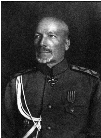
Генерал Микола Ходорович*