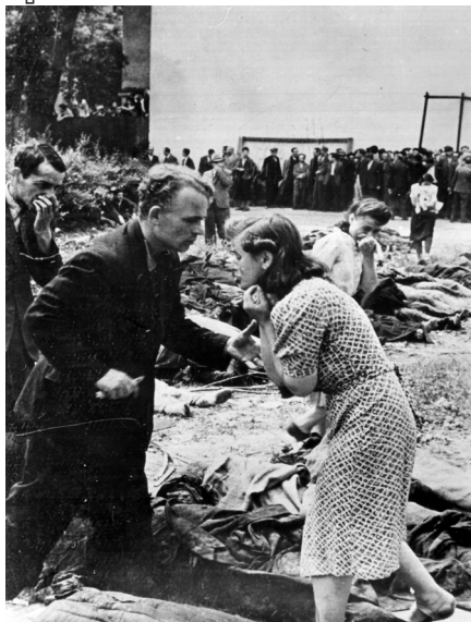
Подвір'я в'язниці на вул. Лонцького у Львові. Люди шукають своїх родичів після масових розстрілів НКВД. Червень 1941 р.

місць призначення прибуло 1 822 в'язні із 5 000 запланованих. Понад 3 000 в'язнів залишилось у тюрмах Львова.