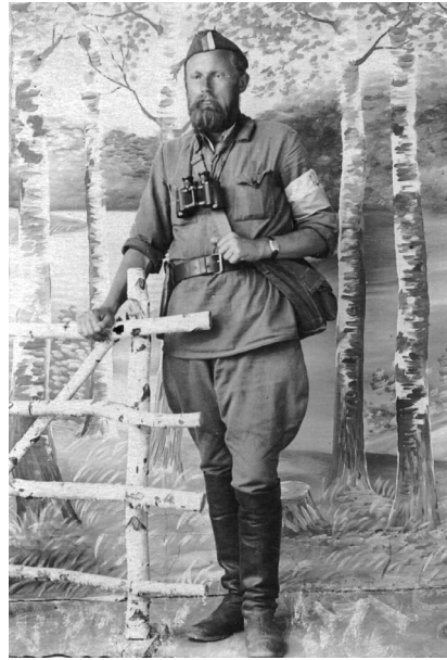
Тарас Боровець — 'Бульба'