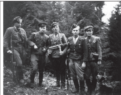
4. Група повстанців. Фото "Липкевича". Світлина №111 з Яворівського архіву УПА.