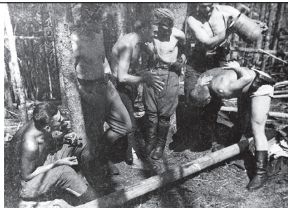
5. Повстанська "лазня".

успішного висліду бою була старанно проведена розвідка, яку здійснила група "Липкевича".