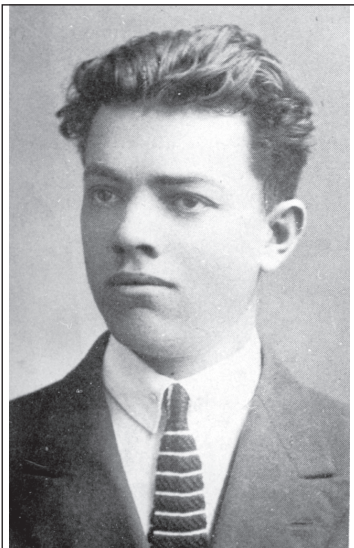
Михайло Колодзінський – "Гузар" - "Кум" - "Богун". Фото 1924 р.