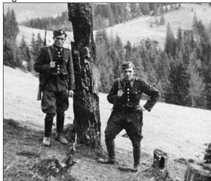
Чехословацькі прикордонники в Карпатах, 1938 р.

ження з угорською стороною в питанні проведення диверсійної акції у Карпатській Україні не принесли жодних успіхів, а ставлення до планів польського консульства в Севлюші було однозначно негативним. «В країні [Карпатській Україні — О. П.] не існує організованої опозиції... Праця в терені опирається тільки на оплачених агентів і набагато перевищує їх можливості. У зв'язку з цим польські плани щодо створення спільного кордону з Угорщиною шляхом проведення спільної диверсійної акції проти Чехословаччини зазнали краху» 77 .