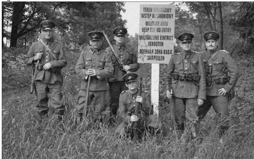
Військовослужбовці польського Корпусу охорони прикордоння, 1938 р.