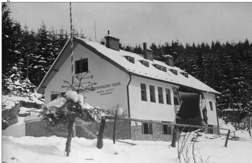
Туристична база «Розсипалова хата» у с. Скотарське на Волівеччині, підірвана внаслідок диверсії польських бойовиків, грудень 1938 р.

ку 1939 р. його змінив П. Курницький). Попри відмову Будапешта пристати на цей план, Варшава не могла, склавши руки, просто пасивно спостерігати за подіями на Підкарпатті. У польському зовнішньополітичному відомстві вважали, що якщо Угорщина не проявить рішучості в карпатоукраїнському питанні з огляду на позицію Берліна, то Польща сама приступить до його вирішення.