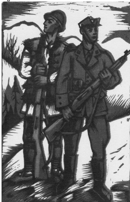
Плакат М. Бутовича, на якому зображено озброєних гвинтівками січового старшину та січовика в цивільному вбранні, які несуть прикордонну службу

дальшому намагалася «ліквідувати Підкарпатську Русь з використанням повної енергії Речі Посполитої» 63 .