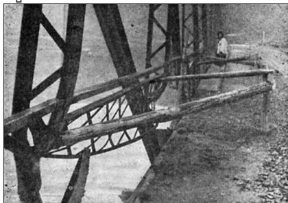
Міст на Чорній ріці біля Торуня, підірваний польськими терористами

оснащених на військовий лад, які мають засилати в Карпатську Україну» 48 .