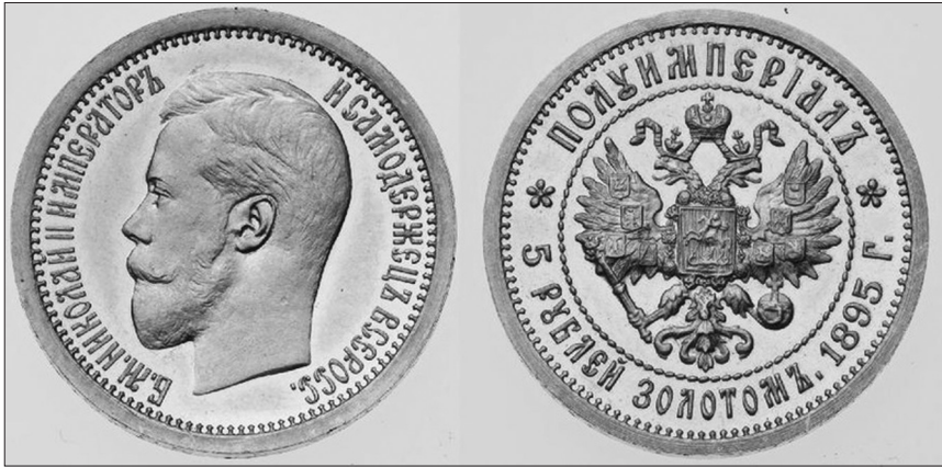
Золота п'ятирублівка, яку використовували підпільники для виготовлення коронок

Шухевич-‘ТарасЧупринка’, в супроводі особистої зв’язкової Галини Дідик-‘Ганни’, кілька разів відвідували квартиру лікаря поліклініки Львівського медінституту Коваля на вул. Леніна 16 . Стоматолог здійснив у себе вдома для головнокомандувача УПА рентгеноскопію щелепи та зубне протезування 17 . Матеріалом для операції були золоті монети Російської імперії — рублі номіналом 5 і 10 рублів. 18