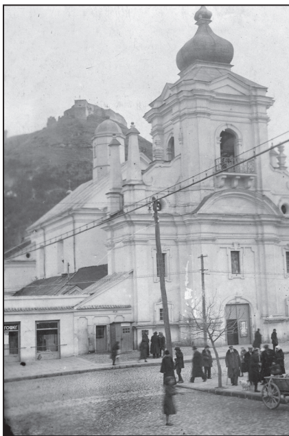
Кременець пер. пол. ХХ ст. Миколаївський собор

Відповідно, українські інтелектуали намагались протидіяти такій політиці влади. Вони перебували в опозиції до польської політики, яка проявлялась у колонізації, переслідуваннях українців, їх окатоличенні тощо. Партії використовували своє легальне становище, при цьому часто діючи революційно-підпільними методами, охоплюючи ідеологічний спектр від крайніх лівих до правих поглядів 15 . Після Першої світової війни українське політичне життя було репрезентоване чотирма найчисельнішими партіями: трудовою, радикальною, соціал-демократичною і християнсько-суспільною 16 . Спочатку всі вони діяли спільно проти польської влади. З цією метою вони заснували Міжпартійну раду, головою якої був Кирило Студинський, а секретарем — Володимир Бачинський. Міжпартійна рада підпорядковувалась екзильному урядові ЗУНР Євгена Петрушевича. Внаслідок нової політичної ситуації (закріплення большевицької влади на Наддніпрянщині та перехід Є. Петрушевича на прорадянську орієнтацію) серед членів Міжпартійної ради виникла велика різниця в поглядах щодо подальшої політичної діяльності, через те у 1923 р. Рада перестала існувати 17 .