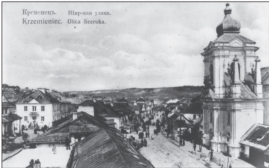
Кременець. Пер. пол. XX ст.

Книга «Інтелігенція Волині: погляд крізь призму часу» розповідає про становлення української інтелігенції Волині, зокрема на Володимирщині, у 20—30-х роках XX ст. 5