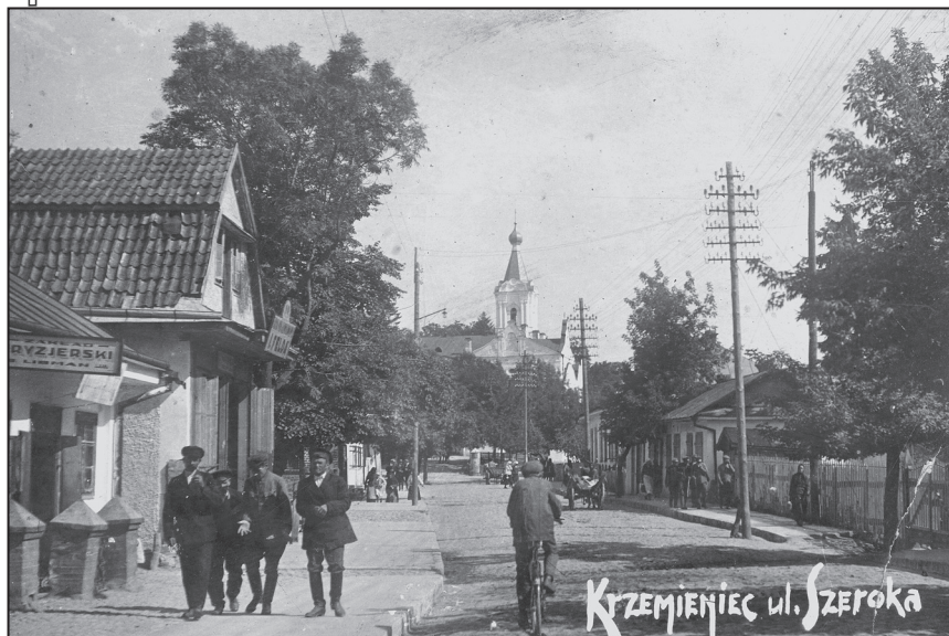
Кременець. Пер. пол. XX ст. Вул. Широка

залежницької платформи та претендувала на провідну роль у суспільстві. Партія була утворена в 1926 р. внаслідок об'єднання Української радикальної партії, що діяла в Східній Галичині від 1890 р., і Волинської організації Української партії соціалістів-революціонерів 42 , утвореної в 1904 р. 43