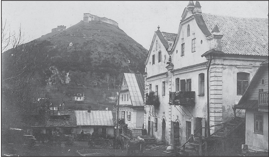
Кременець пер. пол. XX ст. Замкова гора та будинки-близнюки

Впливовою легальною партією було Українське національно-демократичне об'єднання (УНДО), утворене у 1925 р. шляхом об'єднання двох крил Української трудової партії, Української партії народної роботи і Волинської національної групи Української парламентарної репрезентації 18 . У липні 1925 р. провідники УНДО сформулювали політичну програму, в якій висловлювалися за єднання українців для протидії асиміляційним намірам уряду. У програмі зазначалось: «Східна Галичина з Лемківщиною, Холмщина з Підляшшям і Волинь з Поліссям мають споконвічний український характер. Українське населення супроти чужинного елемента є тут переважаючою більшістю. Тому УНДО боротиметься, щоб західноукраїнські землі проти Польщі виступали разом як цілість, і в своїй участі головну увагу приділятиме до вдержання і розбудови одноцілого національного фронту» 19 . На другому з'їзді в листопаді 1926 р. УНДО доповнила програму і в основу своєї діяльності взяла соборність, державність, демократію та боротьбу