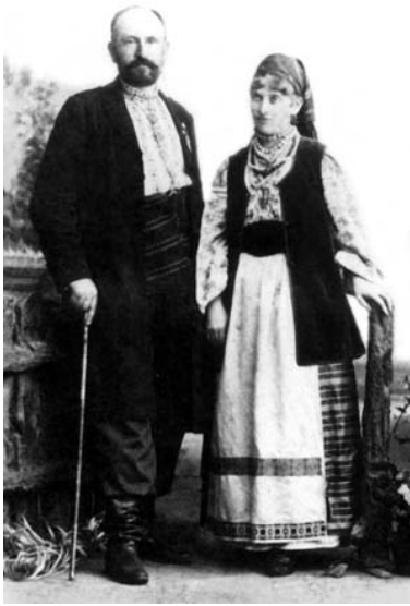
Володимир Шухевич з дружиною Герміною. 1894 р.

У 1970 р. під час відпустки їздив до матері у Львів, а по дорозі відвідав своїх знайомих. Спілкувався з людьми схожою з ним долі й переконань, написав проблемну статтю про визвольну боротьбу «Роздуми вголос», за яку був засуджений на 10 років тюрми особливого режиму і 15 років заслання. Юрій надсилав викривальні статті в ООН, у різні правозахисні організації. За це його повторно засудили у липні 1973 р. на 10 років, звинувативши в спробі передати на волю свої статті з національного питання. У тюрмі в Чистополі Татарської АРСР у 1981 р. він втратив зір. 7 січня 1982 р. йому зробили операцію на очі, але невдало. Після закінчення терміну ув'язнення, 1983 р., його заслали до Сибіру, а потім відправили в інвалідний будинок у Томській області.