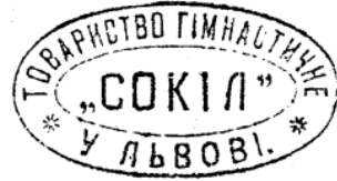
15. Печатка гімнастичного товариства «Сокіл» у Львові. 1894 р.

г) Відбиток чорнильний, круглий (діаметр 42 мм). Без малюнка. Легенда: «“Сокіл-Батько” Львів». В центрі печатки напис: «В. В. В. В.» (сокільське гасло «Все, вперед! Всі, враз!»). Дата відбитка — 1925, 1927, 1928, 1930 рр. 68 (ілюстрація 16);