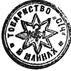
13. Печатка товариства «Січ» у с. Млини. 1913 р.