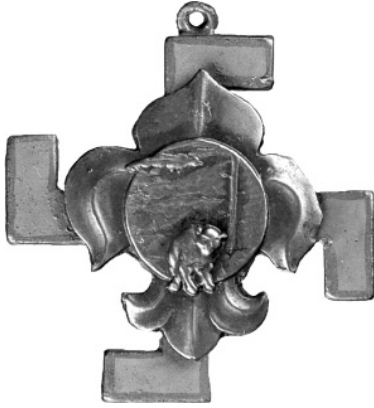
9. Пластова «свастика вдячності»

і підтвердження пластового духу у важких обставинах» 46 .