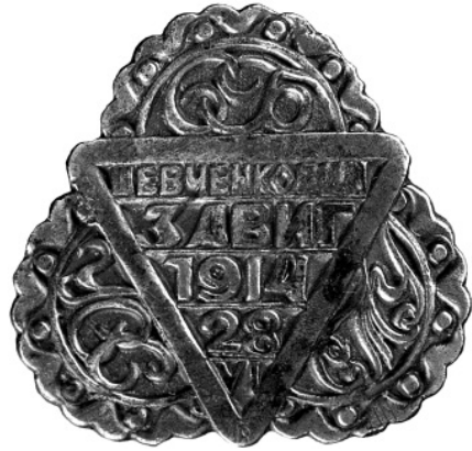
7. Відзнака Шевченківського здвигу у Львові 28 червня 1914 р.