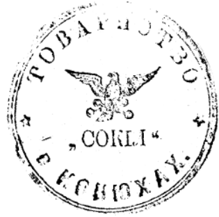
19. Печатка товариства «Сокіл» у с. Конюхи. 1910 р.

Окрім прапорів, відзнак, печаток українських молодіжних організацій заслуговують на увагу однострій з відповідними нашивками та відзнаками. Досліджуючи їх, слід звертати увагу на час та умови, в яких запроваджено однострій, його авторів та вжиток.