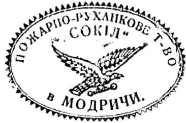
11. Печатка товариства «Сокіл» у с. Модричі. 1929 р.

На печатках товариства «Січ» використовувалося січову емблему в різних варіантах. Перший варіант — дві руки в потиску, які тримають серп. Другий — те ж саме зображення, але вже з восьмипроменевою зіркою. Перший варіант бачимо на печатці Головного січового комітету 58 (ілюстрація 12), другий — на печатках осередків товариств