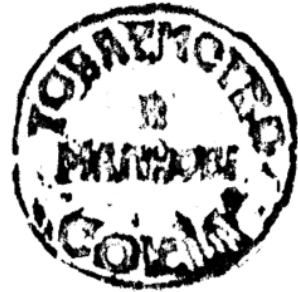
20. Печатка товариства «Сокіл» у с. Малнові. 1930 р.