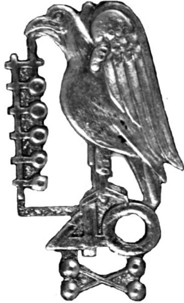
10.2—3. Відзнаки, випущені з нагоди 40-ліття товариства «Сокіл-Батько» у Львові 1934 р.

штук. На третій відзнаці, для руховиків-змагунів, був зображений лише сокіл — без щита 54 .