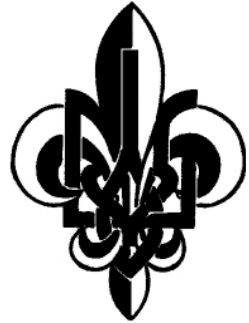
5. Емблема організації «Пласт»

У пластунів кожен пелюсток лілеї відповідав трьом пунктам присяги: бути вірним Богові й Україні; помагати іншим; жити за пластовим законом і слухатись пластового проводу. Зображене посередині вістря вказувало «дорогу вгору», тобто напрям уперед. Тризуб на пластовій емблемі безпосередньо засвідчував те, що товариство «Пласт» — це суто українська організація, яка є частиною міжнародного скаутського руху.