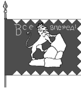
3. Прапор товариства «Сокіл-Батько» у Львові