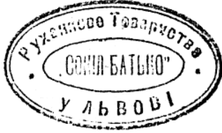
17. Печатка товариства «Сокіл-Батько» у Львові. 1931–1939 рр.

редки товариства «Сокіл» на печатках мали малюнок. Переважно це сокіл, повернений праворуч або ліворуч з гантеллю в кігтях. До прикладу, таке зображення є на печатці товариства «Сокіл» у Під-