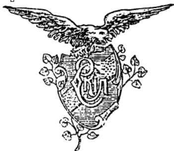
4. Емблема товариства «Сокіл» у Львові. Початок ХХ ст.

з деякими відмінностями та особливостями був сталий для всіх слов'янських сокільських організацій, у тому числі для чехів 26 , поляків 27 та ін.