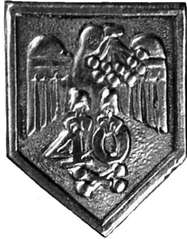
10.1. Відзнака, випущена з нагоди 40-ліття товариства «Сокіл-Батько» у Львові 1934 р.

Їх не завжди можна встановити. У 1934 р. з нагоди 40-ліття існування «Сокола-Батька» у Львові Павло Ковжун розробив три відзнаки (ілюстрації 10.1—3). Перша — щит з білого металу, розміром 20x25 мм, а на ньому птах — сокіл, що тримає в дзьобі кетяг червоної калини, в кігтях — число «40». Під числом — пара гантелей навхрест. Друга відзнака, для учасників у здвигових вправах, мала такий вигляд: у круглому щиті з врізами (розміром 30x23 мм) зображено сокола. Ці дві відзнаки розійшлись у кількості 8 тис.