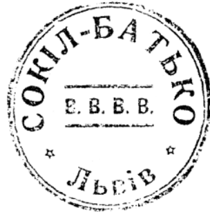
16. Печатка товариства «Сокіл-Батько» у Львові. 1925—1930 рр.