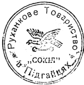
18. Печатка товариства «Сокіл» у с. Підгайці. 1928–1929 рр.

редки товариства «Сокіл» на печатках мали малюнок. Переважно це сокіл, повернений праворуч або ліворуч з гантеллю в кігтях. До прикладу, таке зображення є на печатці товариства «Сокіл» у Під-