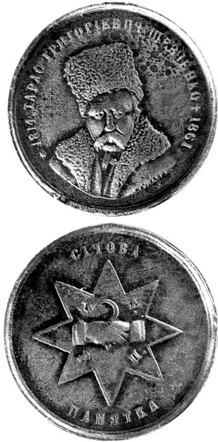
8. Медалі товариства «Січ». 1914 р.