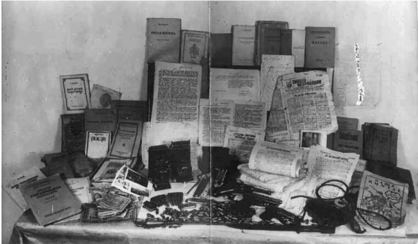
Література, листівки, зброя та інші речі, вилучені в учасників Київської молодіжної ланки ОУН 1948 р.

Підсумовуючи результати дослідження діяльності ОУН(б) в Центральній та Східній Україні, варто зазначити, що найактивнішою вона була за часів німецької окупації в 1941—1943 рр. Саме тоді ОУН(б) вдалося здобути певний авторитет серед молоді. Можливо, це пов'язано з тим, що німці, перебуваючи у стані війни з СРСР, не мали можливості приділити достатньо уваги розгрому підпілля на контрольованих територіях. З іншого боку, частина місцевого українського населення в надії на кращу долю співпрацювала і з німцями, і з ОУН.