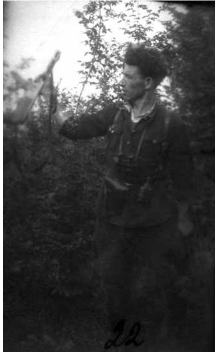
Керівник боївки ОУН у Київській області «Кобзар»

За свідченнями заарештованого керівника пропаганди Скалатського надрайонного проводу ОУН «Леоніда», підпілля надавало великого значення розповсюдженню свого впливу на Схід і особливо активізувало цю роботу з кінця 1949 р. Учасники ОУН знайомили-