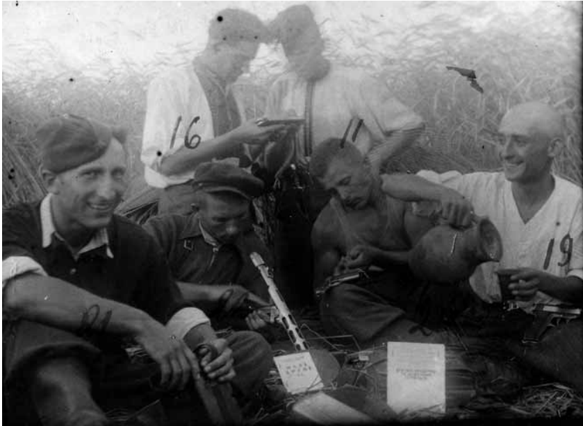
Підпільники з Кам'янець-Подільського окружного проводу ОУН