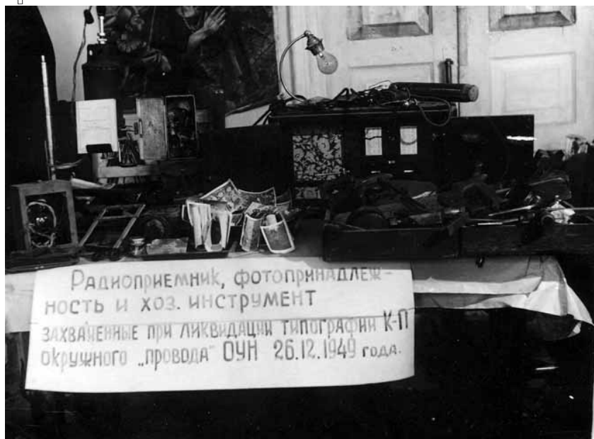
Майно типографії ОУН Кам'янець-Подільського окружного проводу ОУН