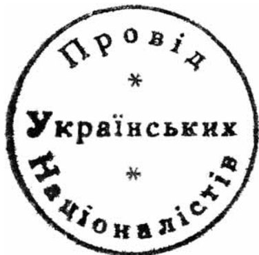
Печатка Проводу Українських Націоналістів. 1929 р.

У липні 1927 р. Д. Андрієвський підготував перелік тем доповідей і доповідачів на майбутній конференції та переслав його Є. Коновальцю, котрий схвалив пропозиції. Постало питання критеріїв добору делегатів. Є. Коновалець писав Д. Андрієвському: «[...] треба би нам порозумітися, кого саме будемо притягати до участі в конгресі, а іменно, чи будемо запрошувати на нього індивідуально поодиноких людей чи може представників певних організацій» 9 . Д. Андрієвський як голова підготовчого комітету підкреслив: «[...] треба змагати, щоби то був справжній Конгрес Українських Націоналістів» 10 . Водночас він вважав, що участь у конгресі мають узяти не лише емігранти, а обов'язково й делегати крайових організацій з Галичини, Волині, Прикарпаття, Буковини та Наддніпрянщини, хотів він також бачити представників зі США й Канади. Є. Коновалець особливо наголошував на широкому представництві українських земель, щоб конгрес набув загальноукраїнського, а не емігрантського характеру. Труднощі з делегатами від галицьких націоналістів, на думку Д. Андрієвського, не мали б перешкодити проведенню конгресу; він наполягав на тому, що «навіть коли б з краю ніхто б не приїхав, нам не можна кидати справу. Навпаки, приступити негайно до практичних заходів до організації як Конференції» 11 . Тут