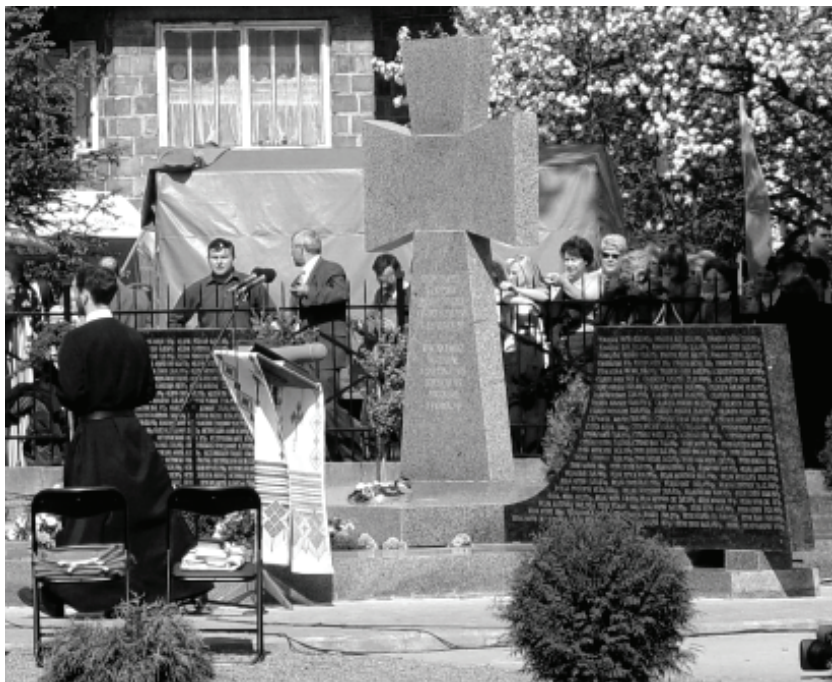
Меморіал загиблим українцям у с. Павлокомі

ської єпископської конференції РКЦ) дещо повторювала слова Блаженнішого Любомира, – він наголосив на примиренні як вияві сили, а не слабкості.